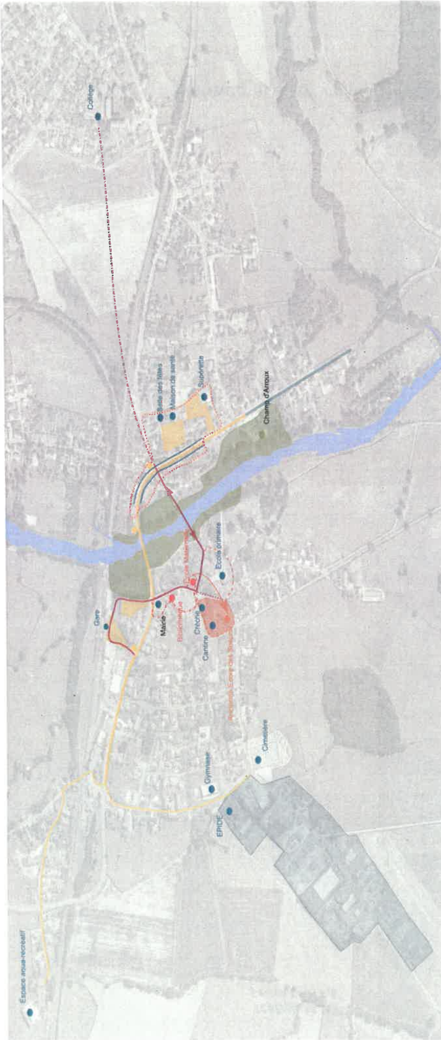
Schéma d'aménagement - Elang-sur-Arroux : apaiser pour créer des espaces plus conviviaux