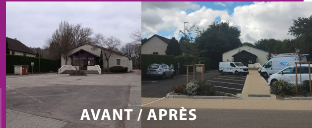
AVANT / APRÈS

Face à une circulation motorisée importante au cœur d'Auxy, la commune s'engage dans une transformation en profondeur vers un aménagement convivial.